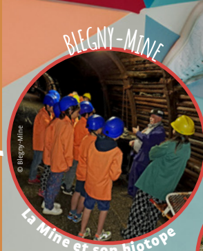
La Mine et son biotope