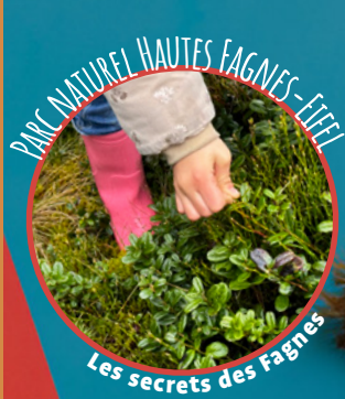
Les secrets des Fagnes