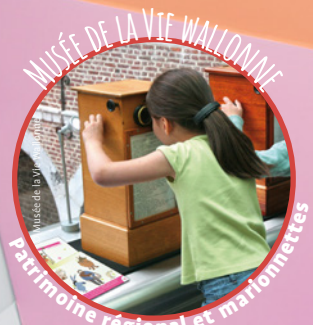
Patrimoine régional et marionnettes

QUITTEZ LES BANCs DE L'ÉCOLE ... APPRENEZ EN DÉCOUVRANT !