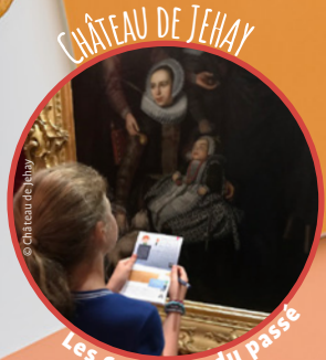
Les coulisses du passé