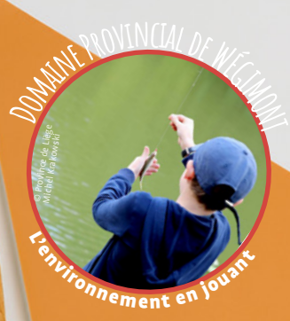
L'environnement en jouant