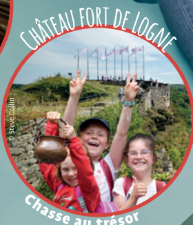
Chasse au trésor